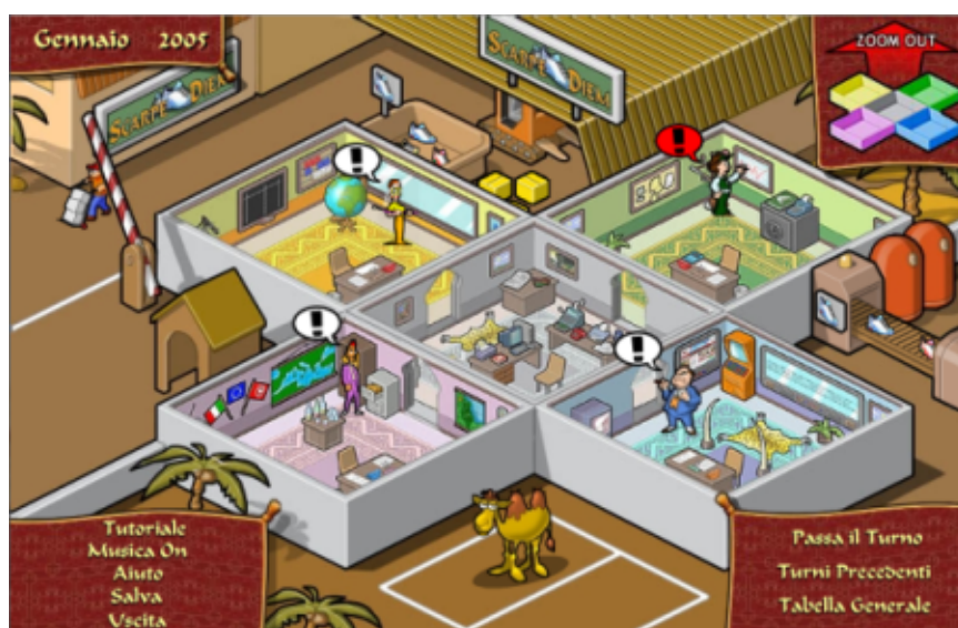
Fig. 4 – Impresa oltre i confini (Mafrau)

Queste simulazioni si possono realizzare (e di fatto si realizzano) anche con un comune foglio di calcolo, ma l'interfaccia può diventare molto accattivante, fino ad avvicinarle a videogiochi in cui gli elementi sulla scena (oggetti e personaggi) consentono di immettere dati e/o di sceneggiare il valore delle variabili più significative (il titolare dell'impresa si lamenta se le vendite cadono sotto una certa soglia).