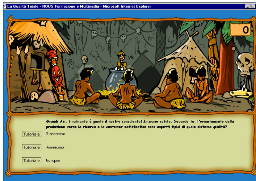
Fig. 3 – La Qualità Totale (Mafrau)

In pratica, in corrispondenza di ciascun nodo si verifica una situazione, come quella in figura, in cui il partecipante è chiamato a determinare il passo successivo scegliendo una delle possibili opzioni di risposta.