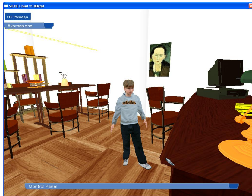
Fig. 2 – Progetto Sisine (Programma Leonardo da Vinci –Capofila Cnr-Istc)